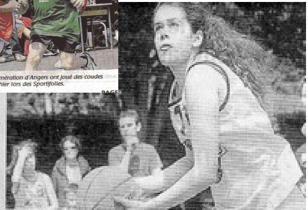
Bien que le classement ne soit pas le principal objectif de cette journée, tous les joueurs sont restés concentrés pour remporter la victoire.