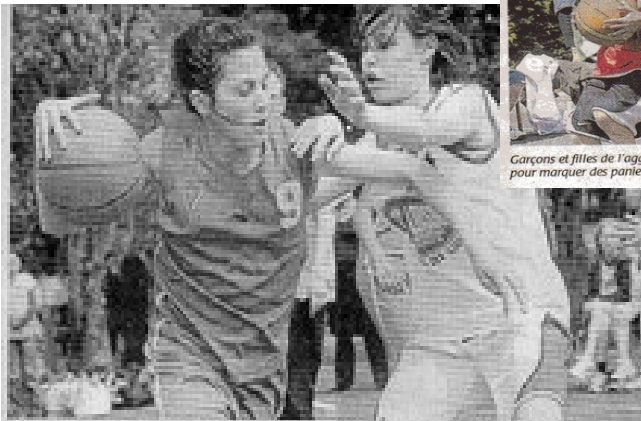
Chaque équipe s'est battue et a défendu ses couleurs : les benjamines d'Avrillé (à droite) ont finalement remporté la victoire.