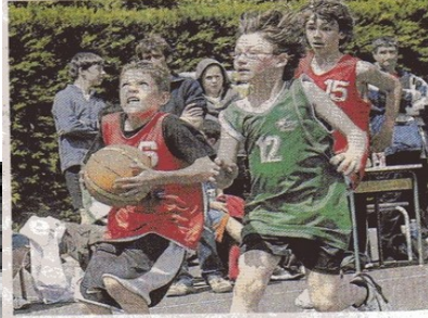
Garçons et filles de l'agglomération d'Angers ont joué des coudes pour marquer des paniers, hier lors des Sportifolles.